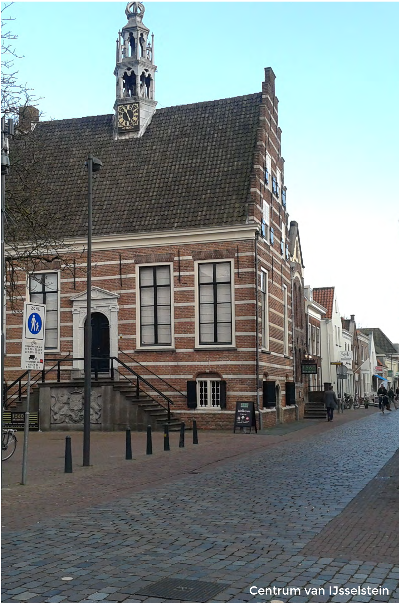
Centrum van IJsselstein