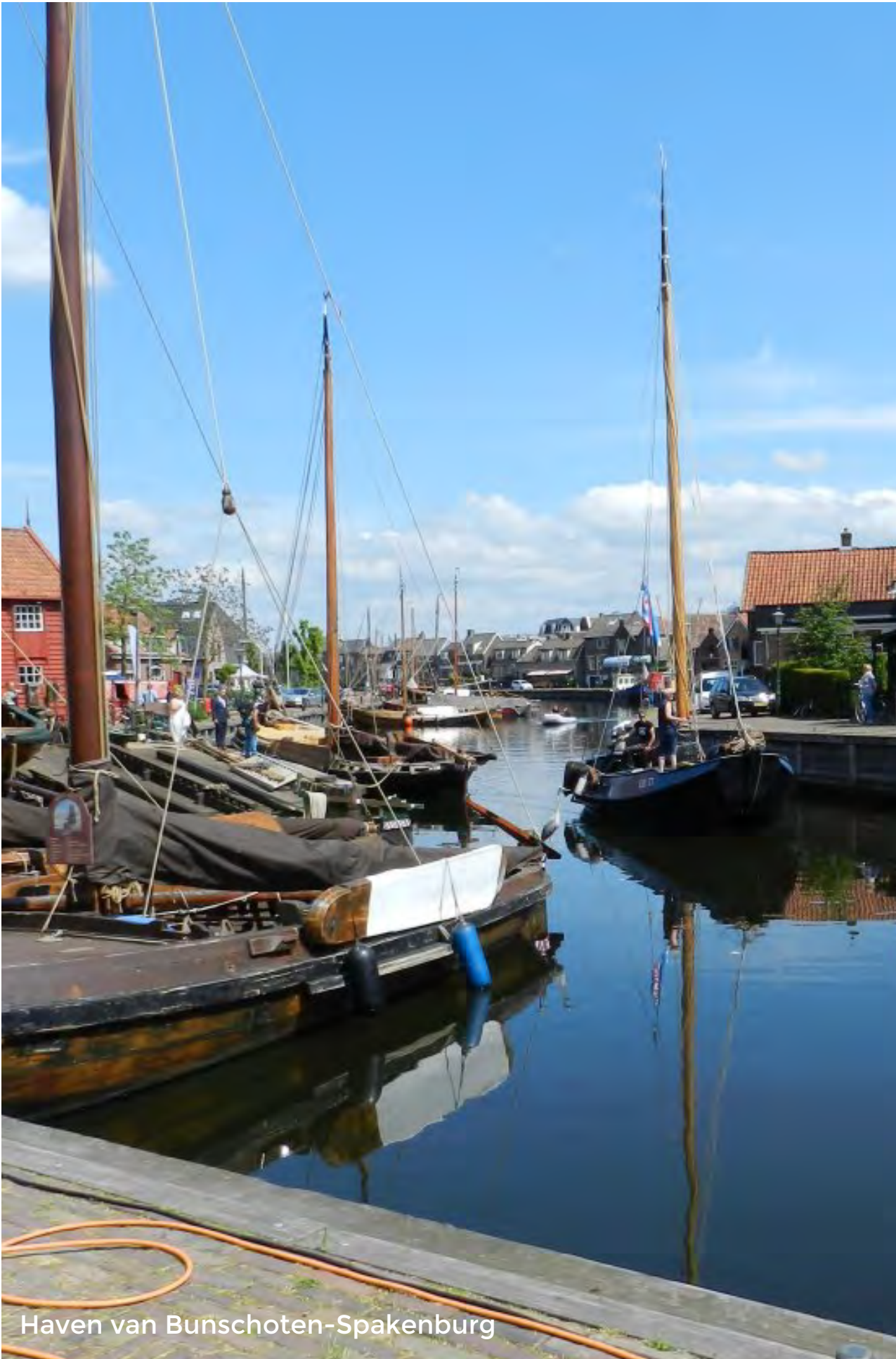
Haven van Bunschoten-Spakenburg