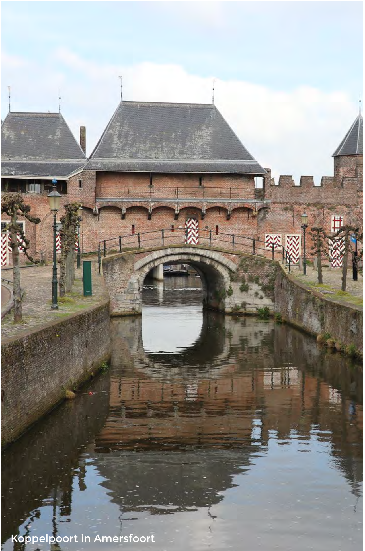
Koppelpoort in Amersfoort