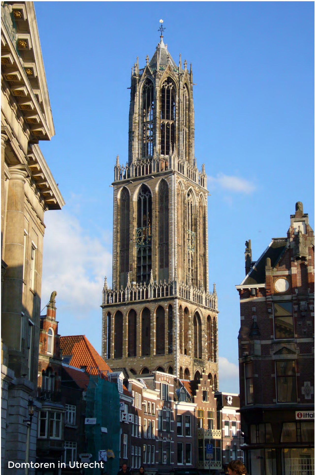
Domtoren in Utrecht