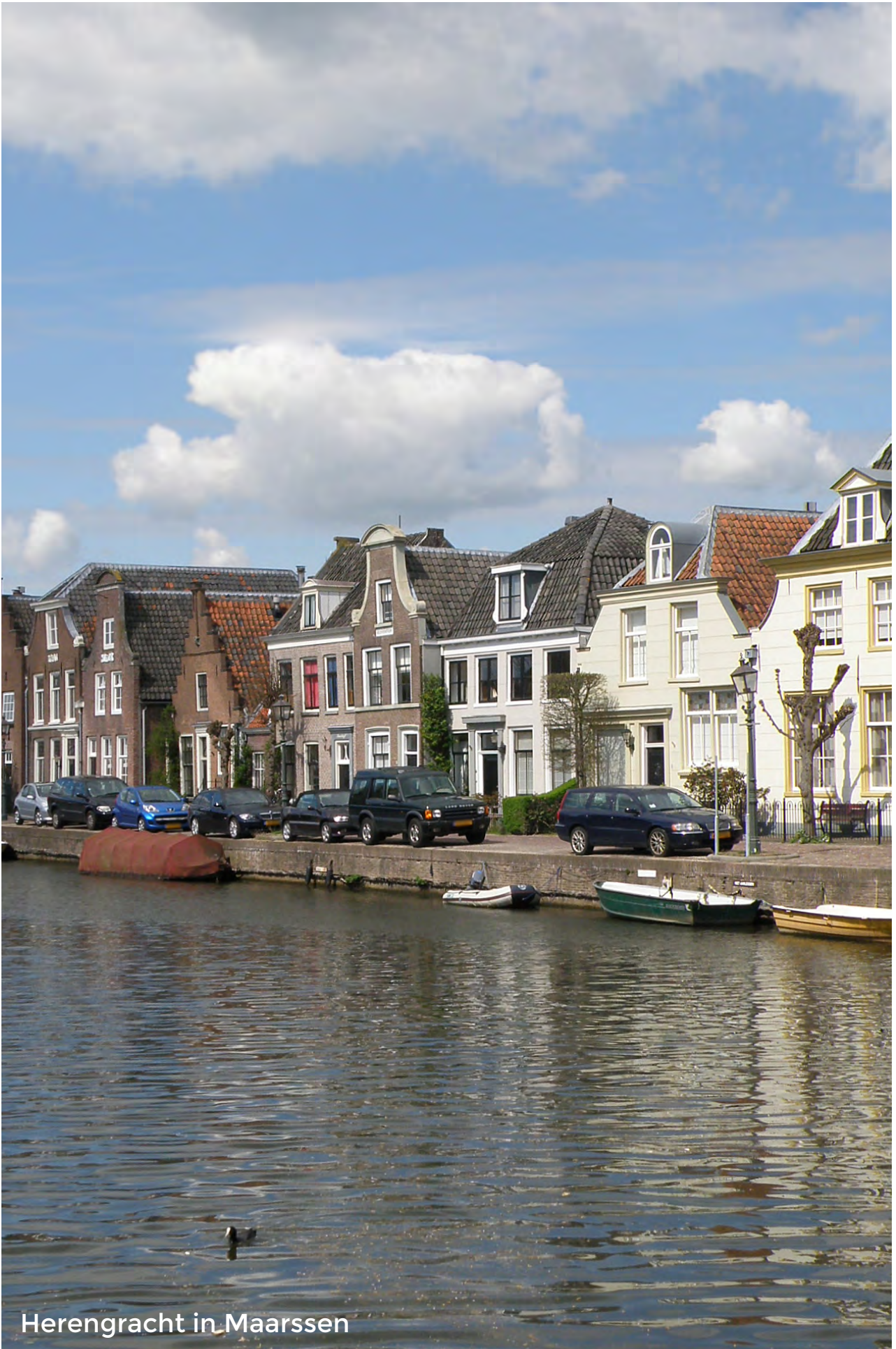
Herengracht in Maarsse