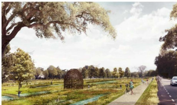
ZICHT VANAF DE SLAPERDIJK, DE TURFWEIDE EN KIJKHUT

De turfweide is een plek waar natuur zich kan ontwikkelen. Door de vele gradënt- en tussen- en oever- en dring- soorten hier veel verschillende plant- en diersoorten. De bloemrijke graslanden, lange grachten, oevers en bomen verzorgen de ecologische waarde van het gebied. Het ontwerp zal bovendien onderliggend zijn aan interessante processen van successie en verandering waardoor het natuureducatieve aspect kan worden benut.