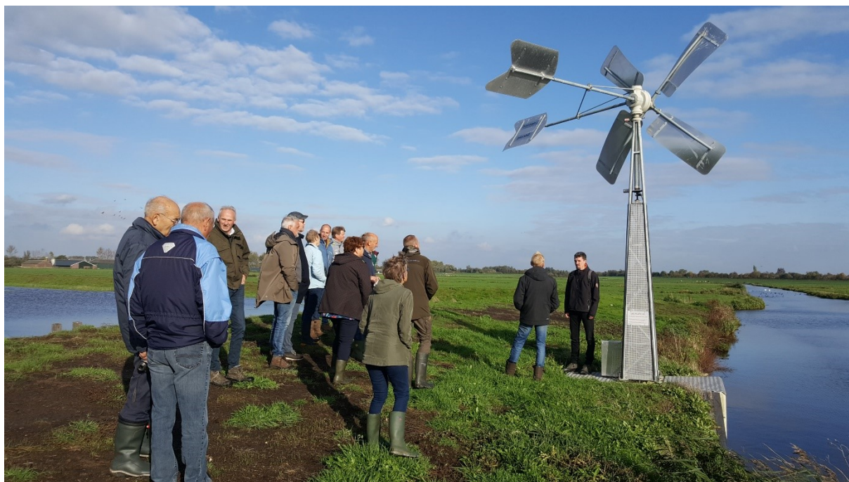
Excursie in het gebied.

Natuurmonumenten heeft in samenwerking met de Provincie Utrecht een excursie gehouden naar Moerasblok 2 en 3. Hierbij waren bewoners en betrokkenen aanwezig en zijn zij meegenomen in de doelstelling van de inrichting, de werking van de moerasblokken en het toekomstige beheer ervan. Ook is er een klein uitstapje gemaakt naar de kunstwerken die zorgen voor de juiste waterhuishouding waarmee het natuurlijke peilbeheer vorm krijgt. Er wordt positief terug gekeken op een informatieve en daarnaast ook erg gezellige excursie.