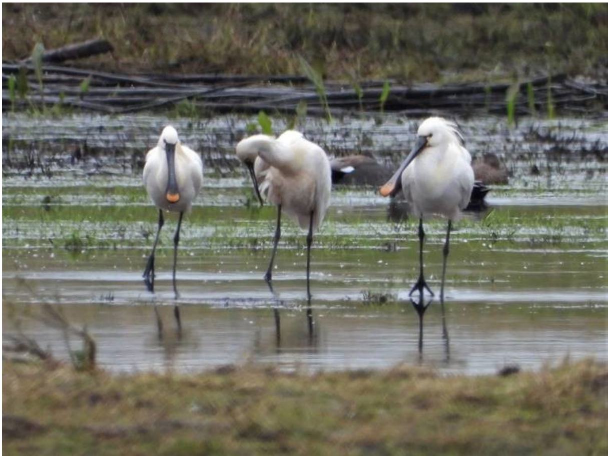
Lepelaars in moerasblok 2.

In de periode maart t/m juni 2019 is door Dirk-Jan van Roest (Natuurmonumenten) een negental vogeltellingen uitgevoerd. We zien dat met name de Grutto, Tureluur en de Kleine Plevier graag verblijven in de Moerasblokken 2 en 3. Maar ook zeker voor vogels zoals de Witgat, Kievit en de Kluut blijft het gebied niet onopgemerkt!