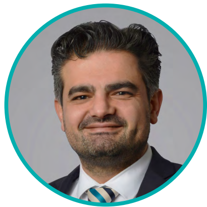
Tunahan Kuzu – Politiek Leider DENK

Ik roep u daarom nogmaals op; ga naar de stembus op 20 maart 2019 en stem op DENK! Voor een eerlijker en rechtvaardiger Utrecht. Voor een eerlijker en rechtvaardiger Nederland.