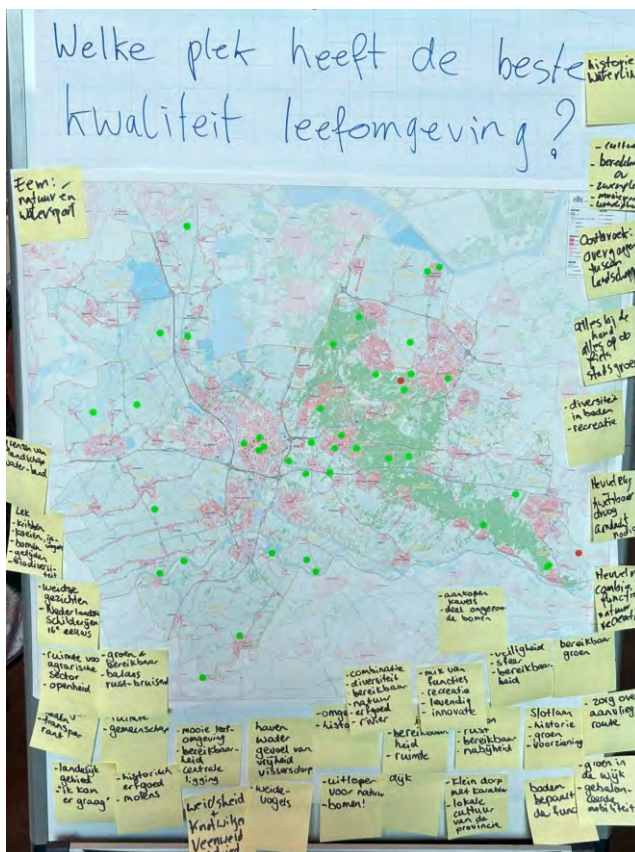
Afbeelding 1: Locaties aangemerkt als gebieden met hoge ruimtelijke kwaliteit, tijdens de informatiemarkt voor Statenleden op 19 april 2023

We staan in Nederland - als overheden, bedrijven, organisaties en burgers - opnieuw voor grote maatschappelijke en ruimtelijke opgaven, rond klimaatverandering, stikstof, energie, woningbouw, migratie, landbouw, versterken van biodiversiteit, bodemdaling veenweidegebieden en mobiliteit. Het aanpakken van deze opgaven heeft invloed op onze leefomgeving. Onze leefomgeving gaat erdoor veranderen. De enorme ruimtelijke transformaties die op ons afkomen, zijn een kans om een impuls te geven aan ruimtelijke kwaliteit.